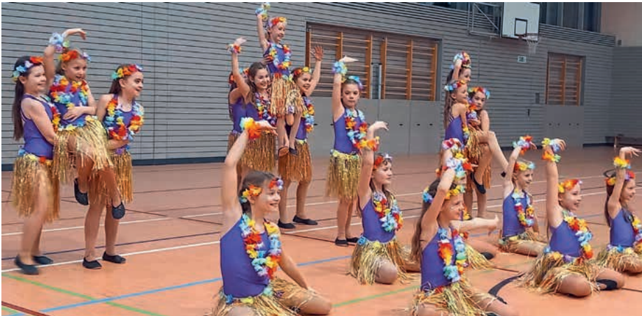
Die 18 Minis flogen nach Hawaii und tanzten Hula-Hula.

dass aus den Trainerinnen und Müttern eine TSV-Jubiläumsgarde zum 100-jährigen Bestehen installiert wurde. Wie Kotiers