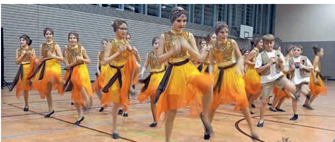
Die Kids bereisten mit 29 Mädels und sieben Buben Afrika