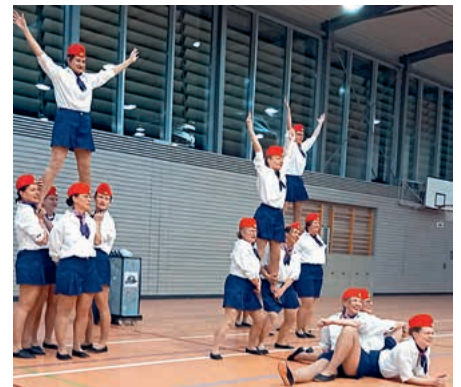
Die Stewardessen der Jubiläumsgarde flog alle Zuschauer um die Welt.