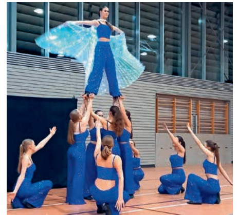
Brasilien und der Rio-Karneval waren das Ziel der 24 „Starlights“