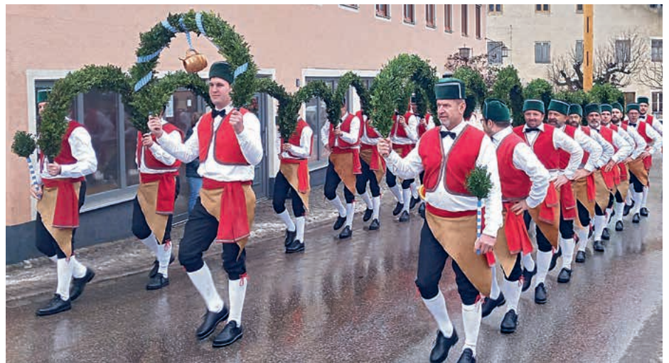
Vom Marktplatz her zogen die Wasserburger Schäffler zum Parkplatz der Sparkasse.