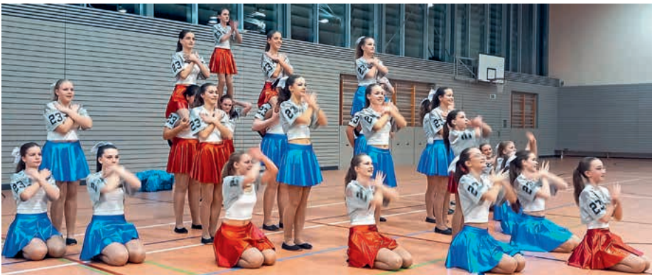
Die Teenies führten ihre Zuschauer in die USA

berichtete wurde seit Monaten jeden Donnerstag ab 15.30 Uhr trainiert „und an manchen Tagen standen wir bis 22 Uhr in