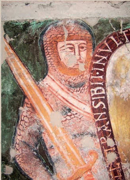
Fresco in der alten Burgkapelle von Werfen aus dem 13. Jahr.

Nach Graf Sighard (um 950) dauerte es etwa 300 Jahre, bis die nächste historische Person in den Urkunden der Archive und damit bei unseren Schnaitseer Straßennamen erscheint: