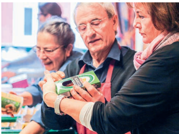
Die Ehrenamtlichen der Traunsteiner Tafel sortieren Lebensmittel-spenden und bereiten sie für die Ausgabe an Bedürftige vor.