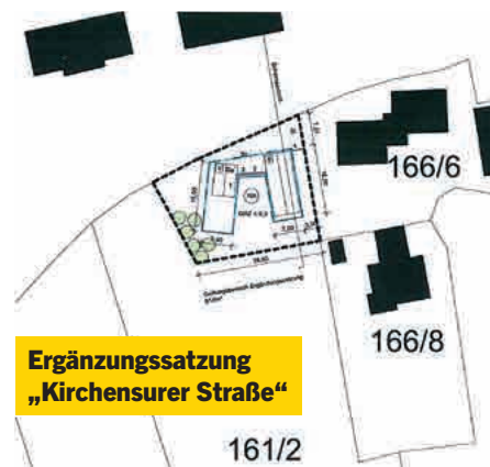
Ergänzungssatzung „Kirchensurer Straße“