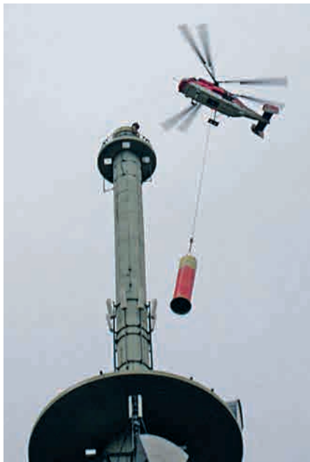
Anfang Dezember 2007 flog ein Hubschrauber die Spitze des Schnaitseer Fernsehturms zu Boden. Die „Turmnarrischen“ retteten sie vor der Verschrottung

Im Dezember 2007 wurden die Antennen und die Turmspitze per Helikopter vom Schnaitseer Fernsehturm entfernt. Die Schnaitseer Faschingsnarren von den sogenannten „Turmnarrischen“ retteten damals