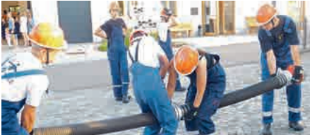
Versiert und gewissenhaft arbeiteten die jungen Feuerwehrler ihre praktischen Prüfungsaufgaben ab.