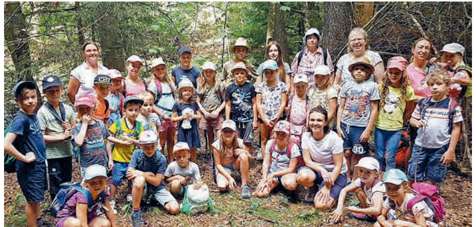
Die Abenteurer am Habamer Mösl konnten an diesem Tag viel erleben

Für gut gelöste Stationen bekamen die Kinder Gold Nuggets aus der Schatzkiste. Am Ende wurden die Abenteurer mit einem Eis belohnt.