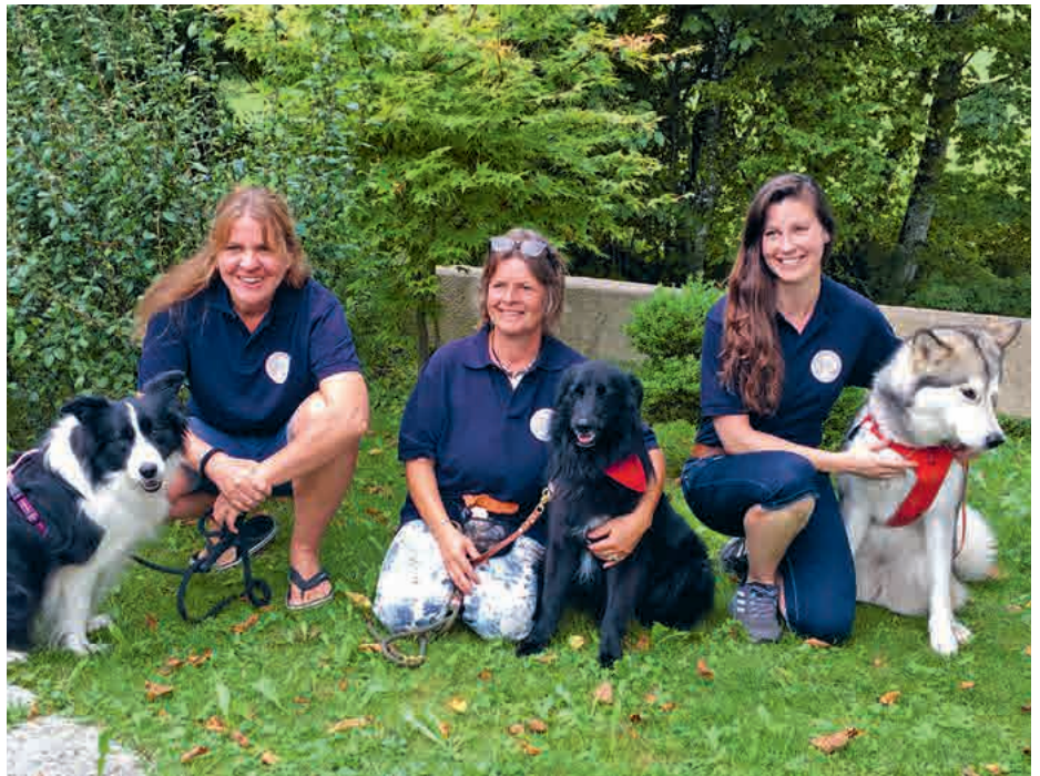
Team der BRK Besuchs- und Therapiehundegruppe nach bestandener Abschlussprüfung

Unsere Hundeteams können Spannungslöser, Bedürfnisaufdecker und Brückenbauer sein. Da sie keinerlei Vorurteile oder Abwehr durch Angst vor Verletzbarkeit kennen, können sie uns lehren, eine Lebenssituation (z.B. eine unheilbare Krankheit) anzunehmen und sich sowohl gegenüber sich selbst, als auch anderen zu öffnen. Tiere nehmen den Menschen so an wie er ist. Sie kennen keinerlei Vorurteile oder Abwehr durch Angst vor Verletzbarkeit. Sie können uns lehren, sich sowohl gegenüber sich selbst als auch gegenüber anderen zu öffnen.