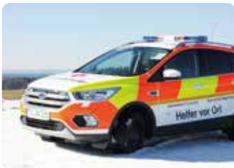
Seit 2019 das neue HvO-Fahrzeug