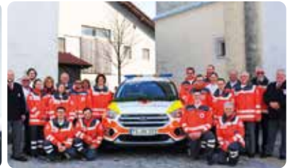
Die Helfer-Mannschaft 2019