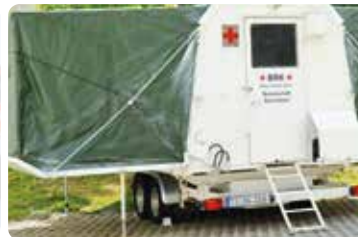
Die mobile Sanitätsstation von außen und von Innen (Platz für vier Verletzte)