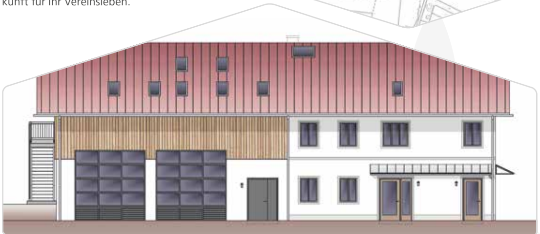
Das neue Dorfgemeinschaftshaus in Waldhausen (Ansicht Nord)