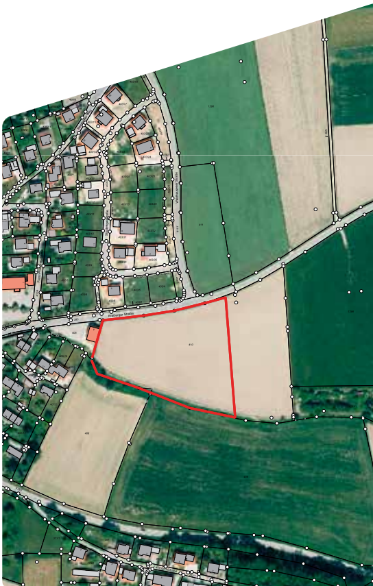
Baugebiet Schnaitsee im östlichen Bereich

Die Flächen für den Wohnbedarf werden aktuell in Schnaitsee am östlichen Ortsrand an der Kreisstraße in Richtung Waltham und in Waldhausen am südlichen Ortsrand vor dem Baugebiet „Waldhausen-Pfarrhofstraße“ ausgewiesen.