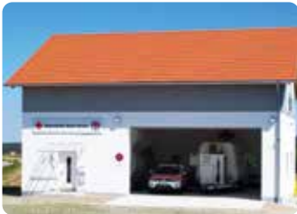
BRK-Gebäude: Die Außenansicht

Die Bereitschaft ist mit der Wasserwacht seit 2017 in der neuen BRK-Unterkunft in der Kraiburger Straße 8 untergebracht: